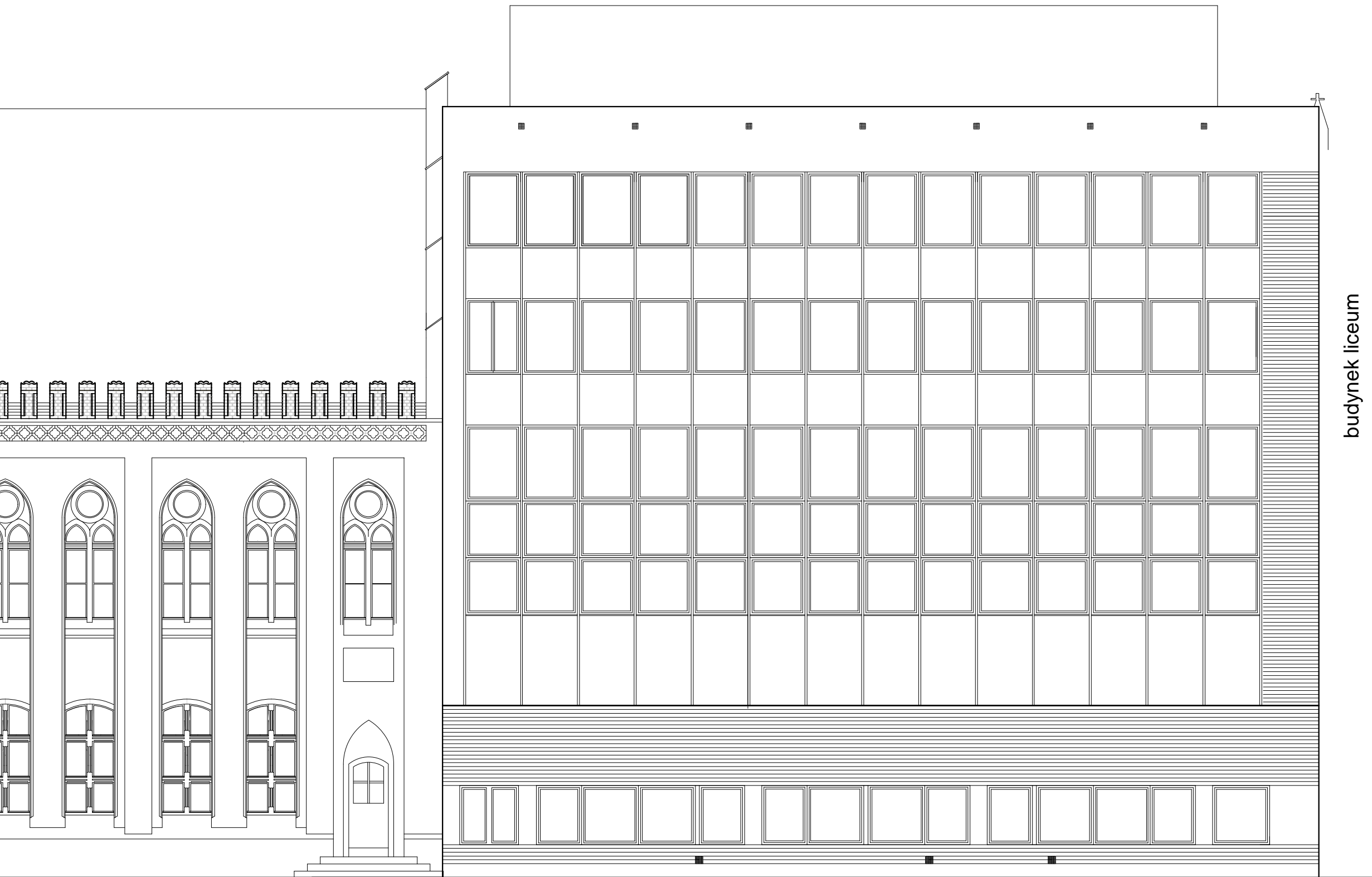
ELEWACJA POLNOCNO-WSCHODNIA - od ulicy Lagiewniki