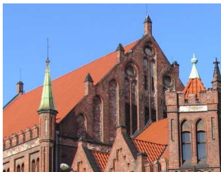
Elewacja pn.-wsch. stan przed