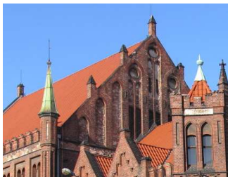
Elewacja pn.-wsch. stan przed