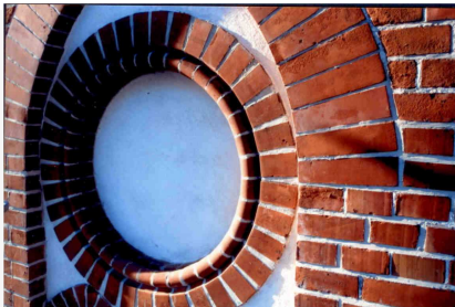
Fragment elewacji przed i po renowacji